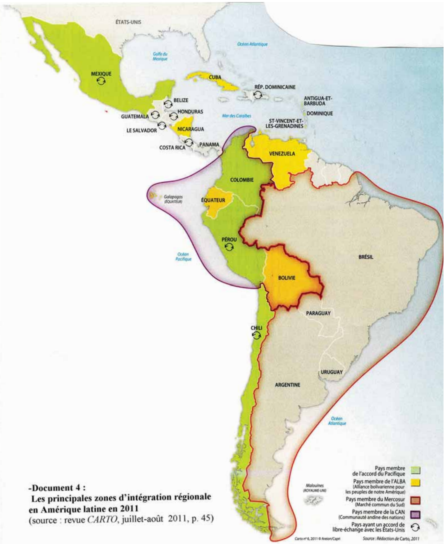
-Document 4 : Les principales zones d'intégration régionale en Amérique latine en 2011